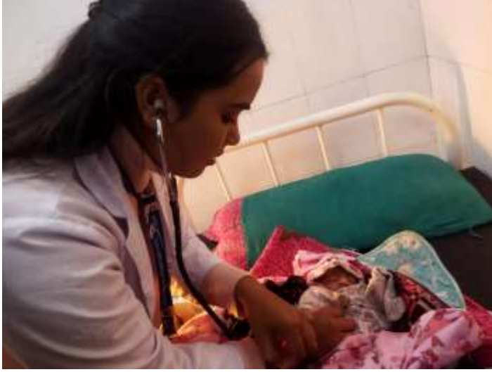
पेलकाचौर स्वास्थ्य चौकी, म्याग्दी

गण्डकी प्रदेश सरकार सामाजिक विकास तथा स्वास्थ्य मन्त्रालय स्वास्थ्य निर्देशनालय पोखरा, नेपाल