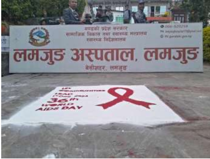
विश्व एडस दिवस @ लमजुङ अस्पताल

अंक १६९, वर्ष ५, २०८० मङ्सिर १७, December 3, 2023 आइतबार