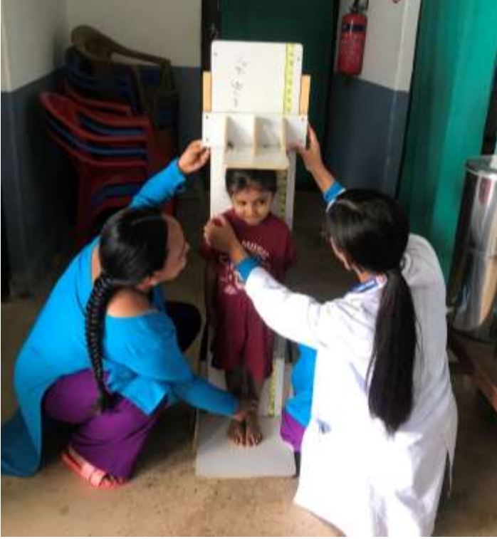
वृद्धि अनुगमन कार्यक्रम @ पाडराड स्वास्थ्य चौकी, पर्वत

गण्डकी प्रदेश सरकार सामाजिक विकास तथा स्वास्थ्य मन्त्रालय स्वास्थ्य निर्देशनालय पोखरा, नेपाल