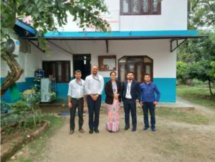
नवलपरासी पूर्वका प्रमुख जिल्ला अधिकारीले मध्यबिन्दु जिल्ला अस्पतालको अनुगमन गर्नुभएको छ।